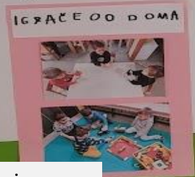
IGRAČE OD DOMA