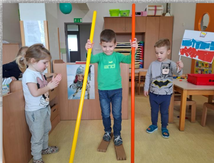
Iz kartona smo izdelali smuči.